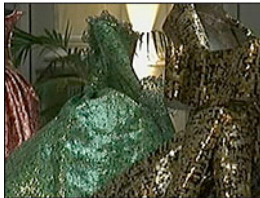
Artista usou 20 mil latinhas

A exposição faz parte de uma campanha para arrecadar fundos para uma casa de ópera e academia de artes líricas na capital grega.